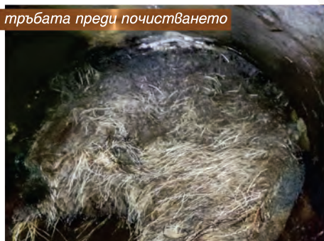
тръбата преди почистването