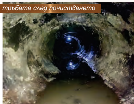
тръбата след почистването