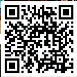
За още снимки - сканирай QR кода