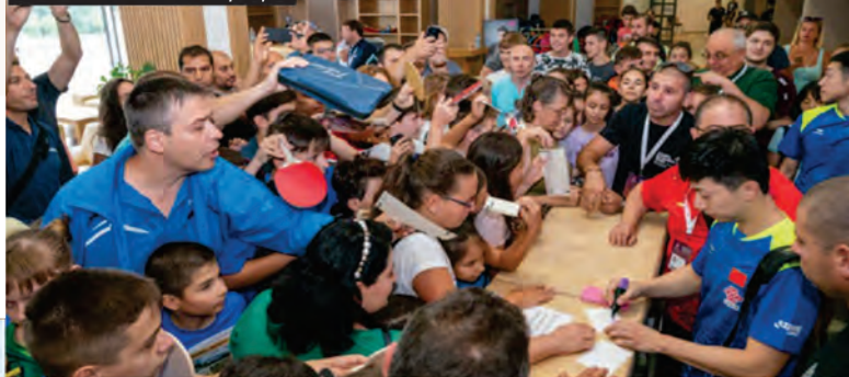
И наплив за автографи