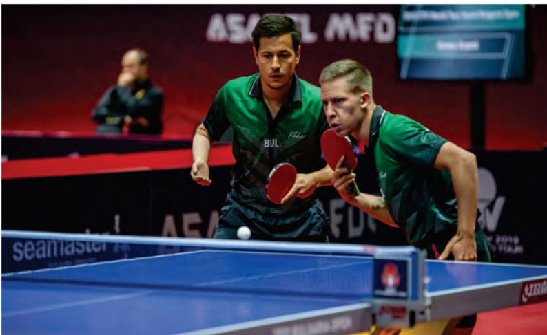
Щастие от медалите в Панагюрище