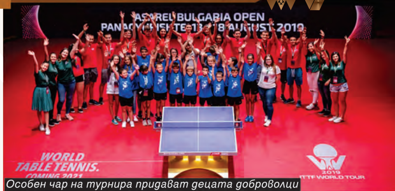
Особен чар на турнира придават децата доброволци