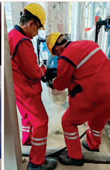
Почистване на филтър на отоплителна инсталация