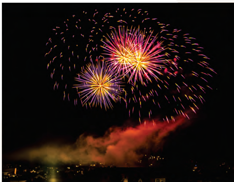
Благодарим на нашия колега Манол КРОНАРОВ, който ни изпрати своите красиви фотографии на фейерверките