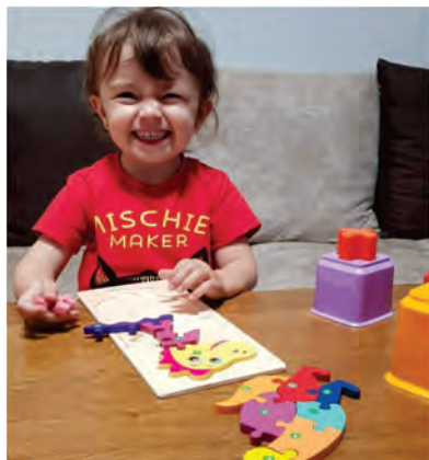
Радина ХАИНОВА, 2 г. 7 м.