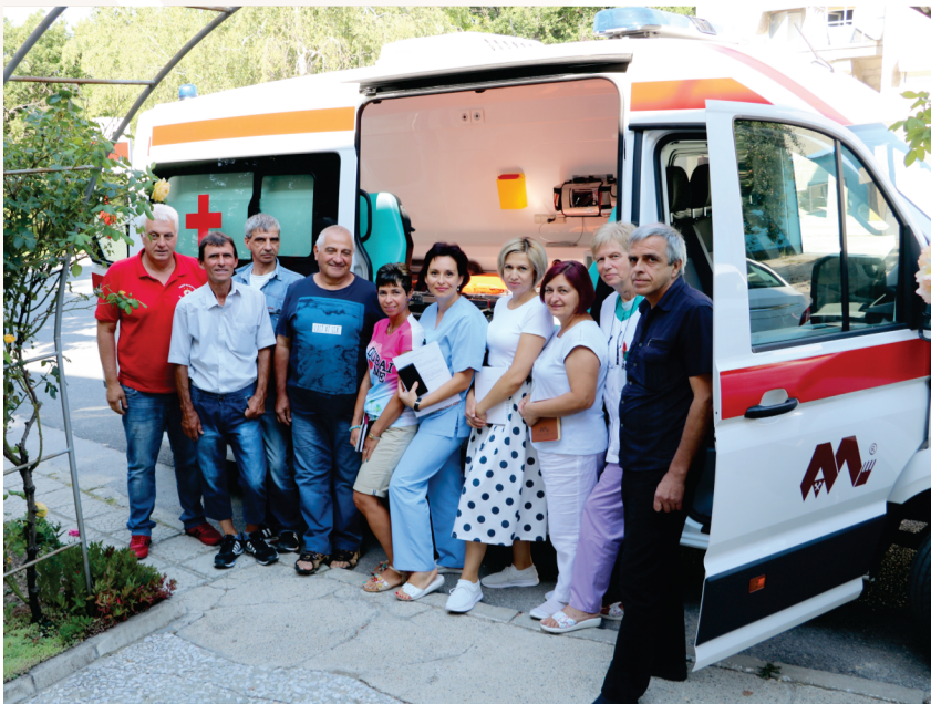
Екипът на Здравна служба „Асарел“ заедно с шофьорите на линейки

Денят на колегите е наситен с големи предизвикателства. При тях работата не е планирана и няма строго модифицирана рамка. „Даваме всичко от себе си! Всички ни