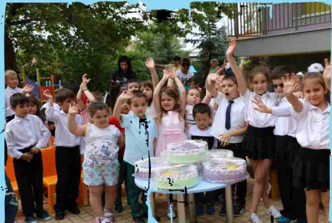
ЦДГ „Първи юни“, гр. Панагюрище