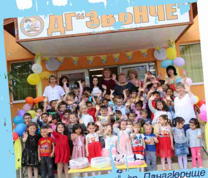
ОДЗ „Звонче“, гр. Панагюрище