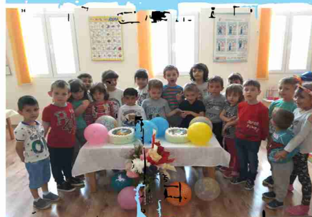
ДГ „Мечо Пух“, с. Оборище