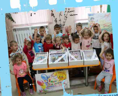
ДЗ „Райна Княгиня“, гр. Панагюрище