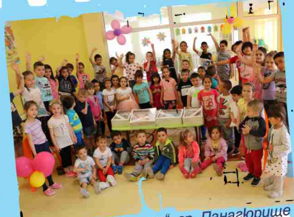
ДЗ „Райна Княгиня“, гр. Панагюрище /филиал/