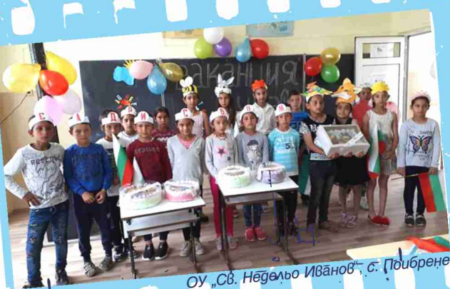
ОУ „Св. Недельо Иванов“, с. Поибрене