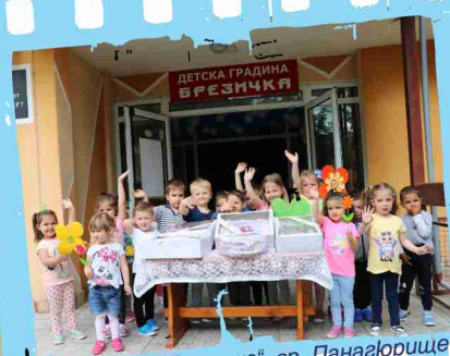
ЦДГ „Брезичка“, гр. Панагюрище