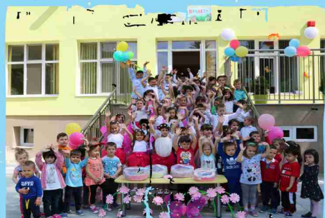
ДГ „Пролет“, гр. Панагюрище