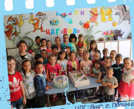
ЦДГ „Яна“, с. Попинци