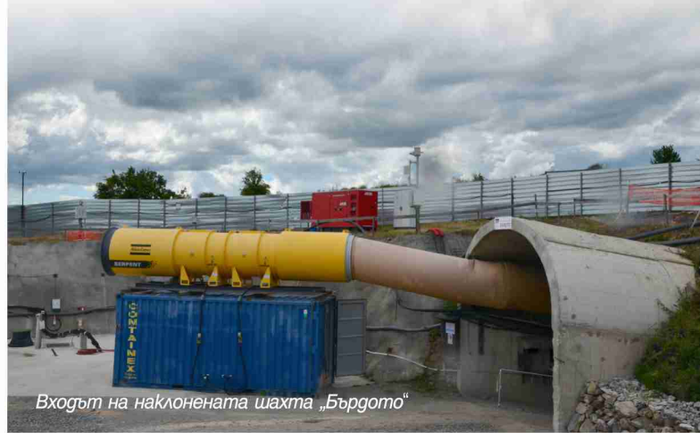
Входът на наклонената шахта „Бърдото“

Очаква се добивът на златно-сребърни руди в бъдещия подземен рудник „Милин камък“ да стартира до 2023 г., като инвестицията е за над 120 млн. лв. В края на третата година от получената концесия в гружеството вече са наети 72 души, като над 40 от тях са местни хора. Предвидено е, когато мината заработи, да бъдат ангажирани 430 работници и специалисти, от които над 350 ще са със средно и средно специално образование. Преди да започне строителството на надземния рудничен комплекс, работата си трябва да приключат археолозите, които вече трети сезон извършват проучвания.